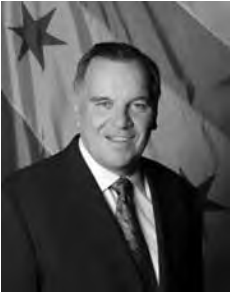
RICHARD M. DALEY MAYOR